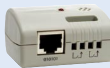
Датчик параметров окружающей среды

Обеспечьте независимое управление различными устройствами. С помощью мультипорта к одному ИБП можно последовательно подключить до 6 устройств с различными операционными системами. Адаптер может производить мониторинг и управлять работой этих устройств.