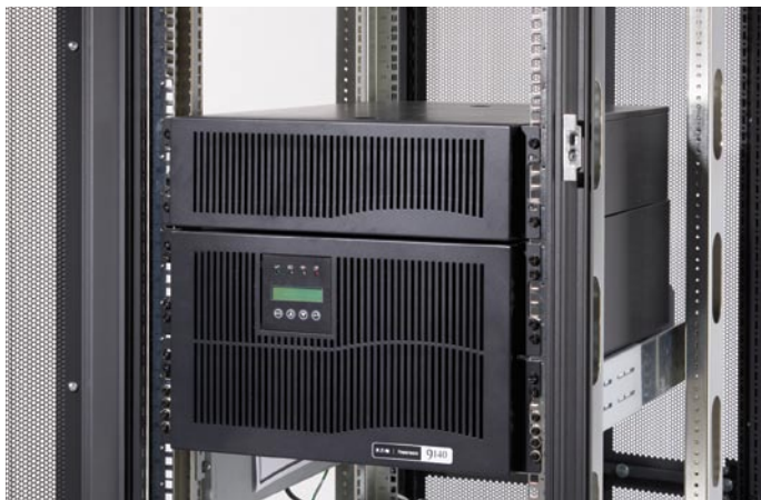
ИБП Powerware 9140 и внешний батарейный блок занимают всего 9U