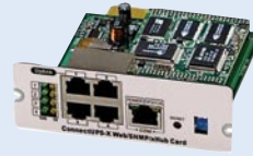
Адаптер ConnectUPS Web/SNMP

Powerware 9140 в стандартной комплектации оборудован портами USB и RS-232, обеспечивающими обмен информацией с управляющим работой источником ПО. Вы можете расширить возможности вашего ИБП, выбрав дополнительные коммуникационные адаптеры.